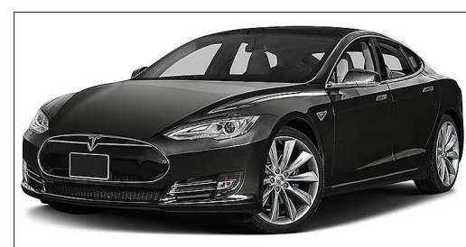
Tesla model S может на полном заряде аккумулятора преодолеть 426 километров