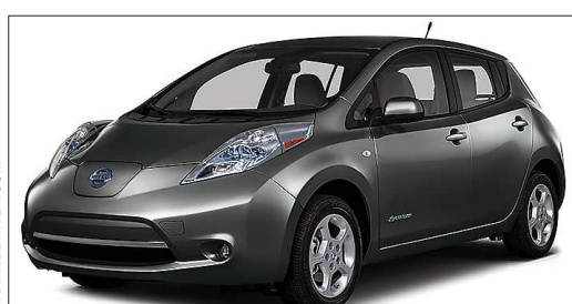
Зарядка батареи Nissan Leaf хватит на 175 километров пути