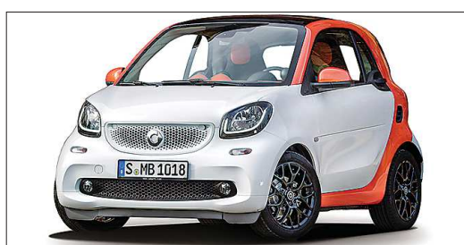
Smart Fortwo на электричестве способен преодолеть 110 километров