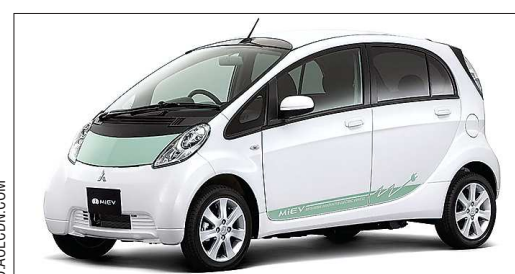
Зарядка аккумулятора Mitsubishi i-MiEV хватает примерно на 150 километров пробега