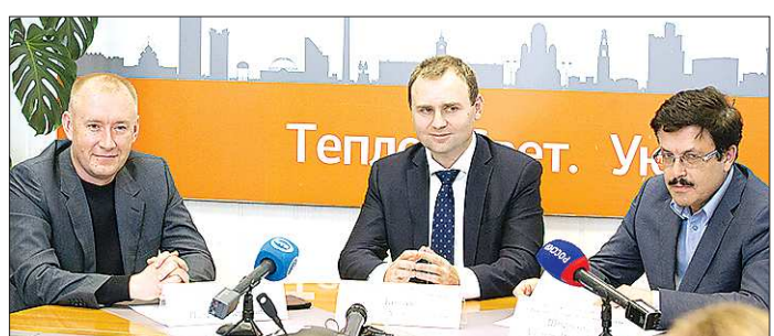
Энергетики уверены: от качества платёжной дисциплины зависит прохождение региона через отопительный сезон