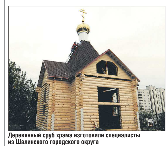
Деревянный сруб храма изготовили специалисты из Шалинского городского округа

Сейчас екатеринбургский храм во имя Николая Чудотворца действует, причём посещают его не только пациенты областного наркологического диспансера, но и жители Заречного и других микрорайонов.