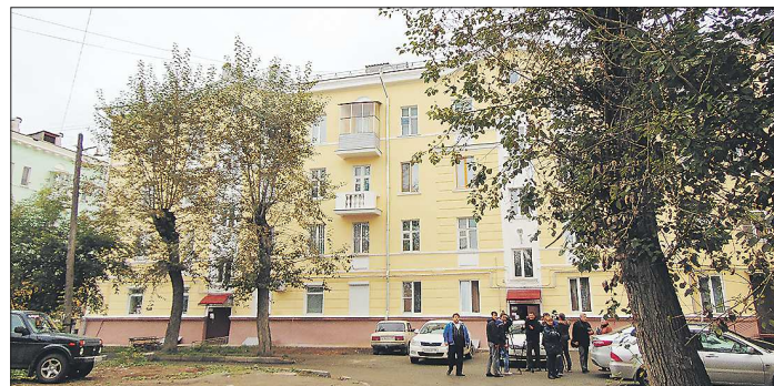
Дом постройки конца 40-х годов на улице Карла Маркса в Нижнем Тагиле после ремонта стал похож на элитное жильё. И таких домов здесь целый квартал

В домах заменены системы теплоснабжения, отремонтированы фасады и фундаменты, утеплены и приведены в порядок чердачные и подвальные помещения, восстановлены рассыпающиеся балконы и карнизы. Успешно прошли проверку сентябрьскими дождями новые кровли. В качестве бонуса жители получили ремонт в подвез-