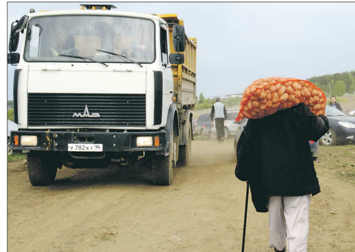
Своя ноша, конечно, не тянет, но вот добираться до покупателя иной раз непросто — путь оказывается тернист и извилист

Пожилые люди копаться на грядке ещё могут, а таскать кабачки на рынок уже не в состоянии. Я, например, больше пяти килограммов не поднимаю, мне бы до дому урожай довезти на общественном транспорте, — говорит она. — Однажды была я в Братске, там в коллективные сады в наземное время приезжает машина, и садоводы по установленной цене сдают овощи, малину и другие ягоды. Почему бы и у нас не сделать так же?