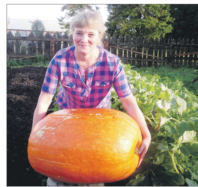
Небывалый по шалинским меркам овощ не каждый сможет поднять