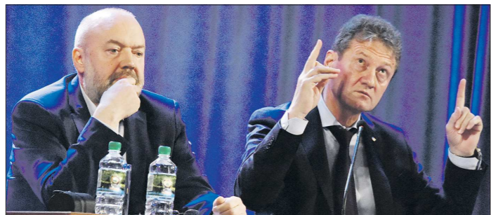
Павел Крашенинников (на фото слева) заметил, что для более оперативного решения вопросов территорий необходимо выстраивать вертикаль работы органов власти и предприятий

— По этому вопросу есть договорённость с губернатором. Мы уже купили проект но-