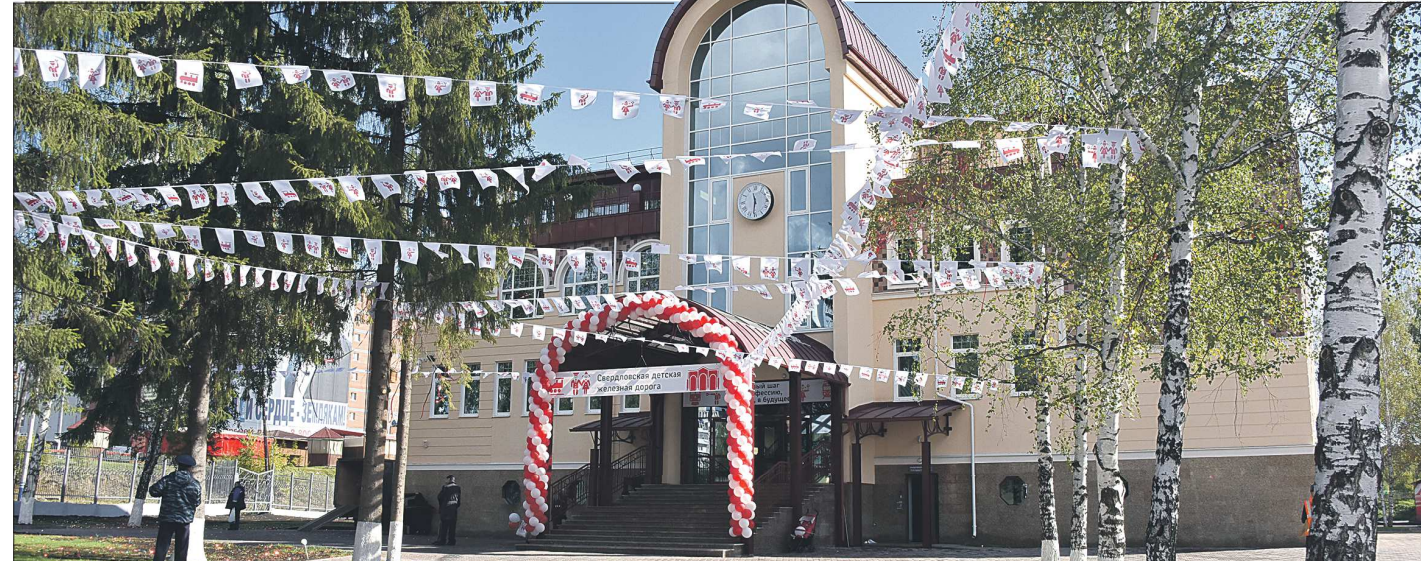
Новый комплекс зданий и сооружений Детской железной дороги включает в себя четырёхэтажное здание вокзально-проформентационного комплекса, эстакаду, локомотивно-вагонное депо, путевое хозяйство и другие объекты. Общая стоимость проекта составила 735,4 миллиона рублей

Проект реализован в рамках соглашения о взаимодействии и сотрудничестве между ОАО «РЖД» и Свердловской областью на 2014–2016 годы. В ходе реконструкции обновлено путевое хозяйство,