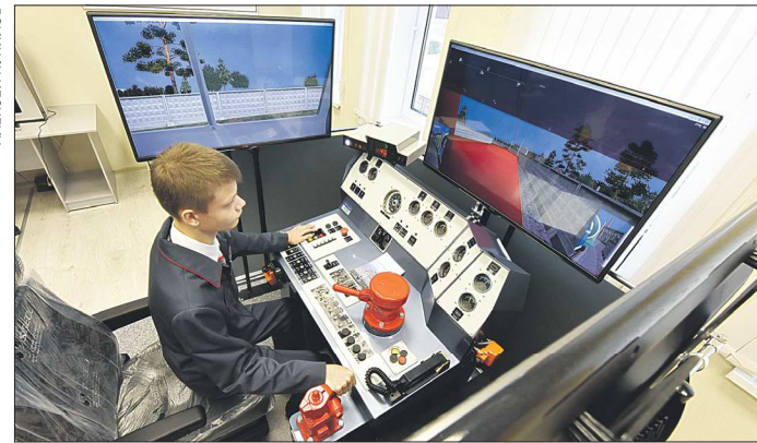
После реконструкции в учебном центре появился тренажёр «Торвест-Видео», он используется для отработки навыков управления локомотивом и вождения поезда

– Основную часть работы мы сделали. В дальнейшем оборудуем учебные классы дополнительными тренажёрами и другими современными средствами для изуче-