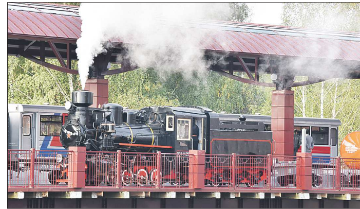
Этот паровоз станет одним из действующих экспонатов музея узкоколейной техники, который в ближайшем будущем откроется на Детской железной дороге

ство, возведена эстакада, построено новое четырёхэтажное здание вокзала, где разместились билетные кассы, зал ожидания, медицинский кабинет, а также учебный комплекс с техническими классами для изучения железнодорожных профессий.