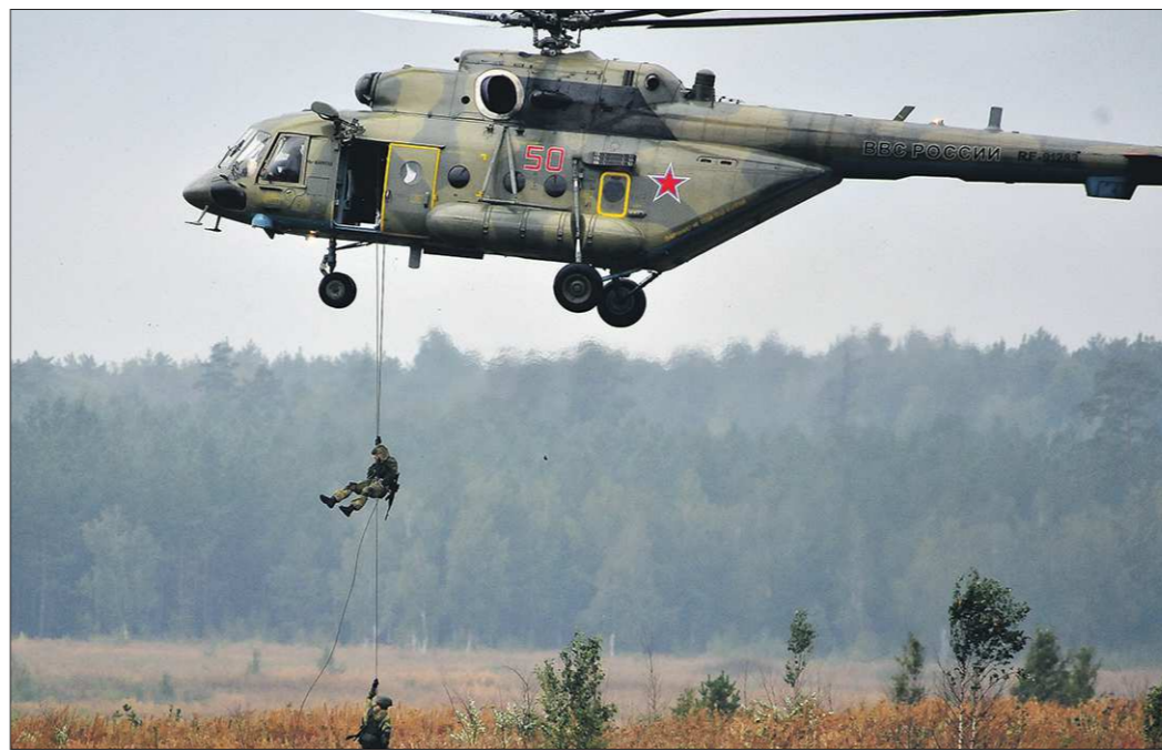
Вертолёт редкой модификации Ми-8АМШТ высаживает десант с помощью спускового устройства

Участие в форуме бесплатное, однако прослушать деловую программу смогут лишь зарегистрированные участники в возрасте от 18 до 30 лет. Зарегистрироваться можно предварительно на сайте www.eurasia96.ru или на входе в Ельцин-Центр. Организаторы ожидают около полутора тысяч участников, поэтому просят желающих пройти регистрацию заранее. Это сэкономит время в очереди и гарантирует попадание в списки присутствующих, даже если количество мест на мастер-классах и лекциях будет ограничено.