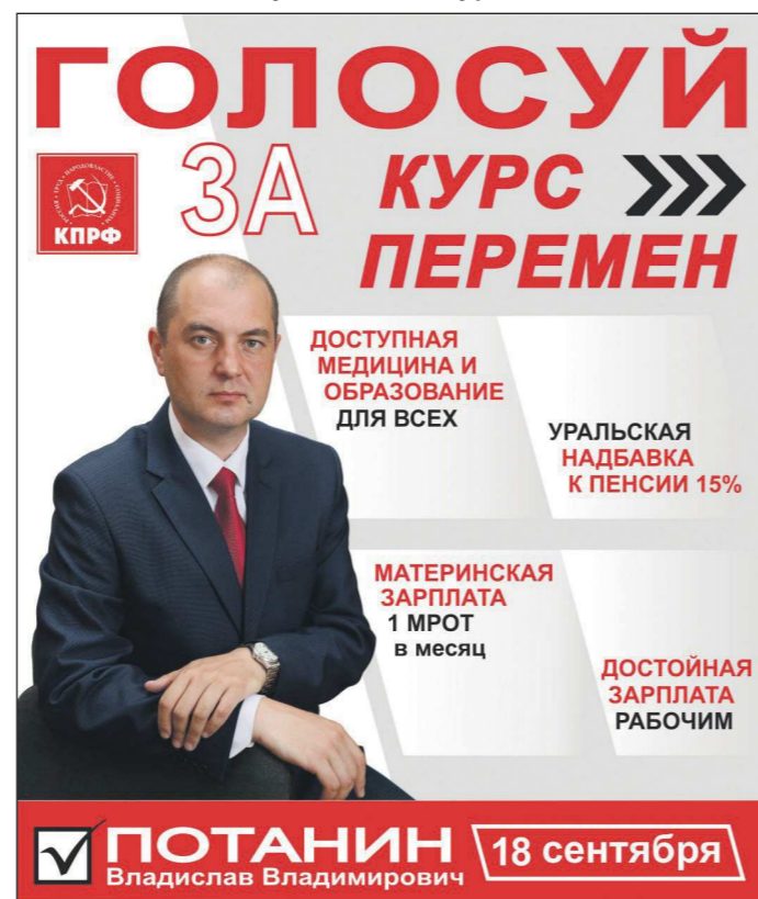
Нижнетагильский одномандатный избирательный округ №171