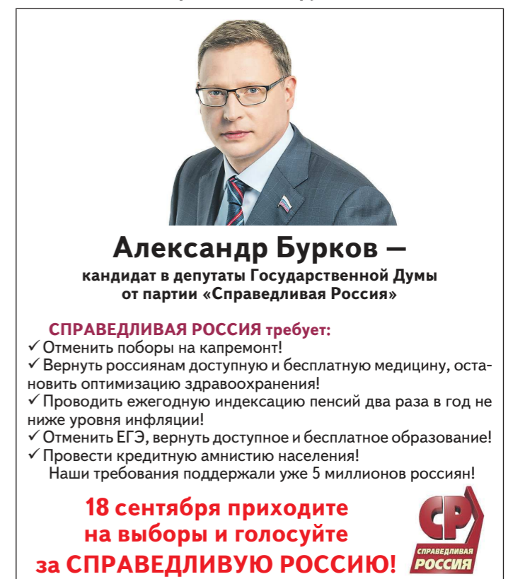
Нижнетагильский одномандатный избирательный округ №171