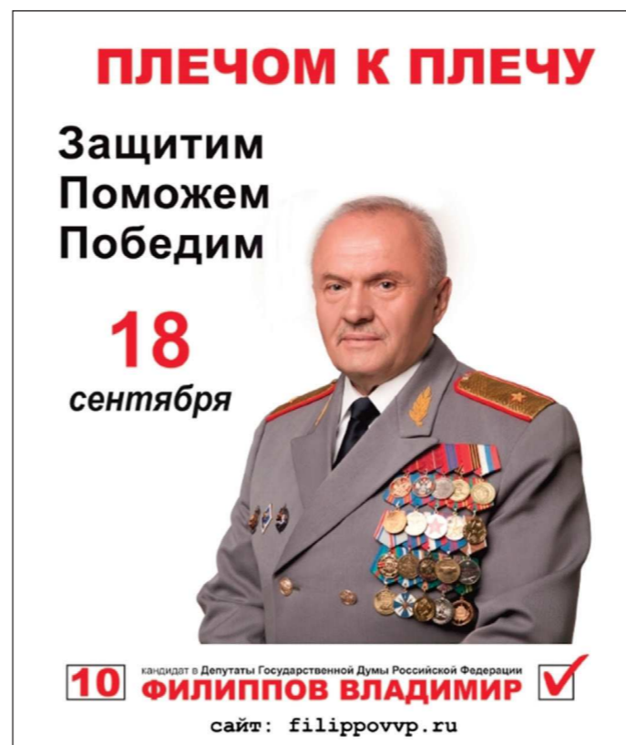
Асбестовский одномандатный избирательный округ №172