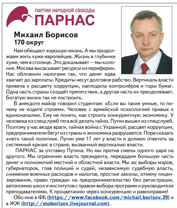
Берёзовский одномандатный избирательный округ №170