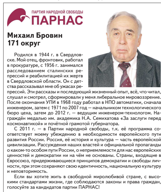
Нижнетагильский одномандатный избирательный округ №171