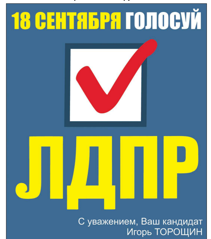
Асбестовский одномандатный избирательный округ №172