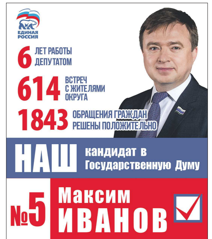
Асбестовский одномандатный избирательный округ №172