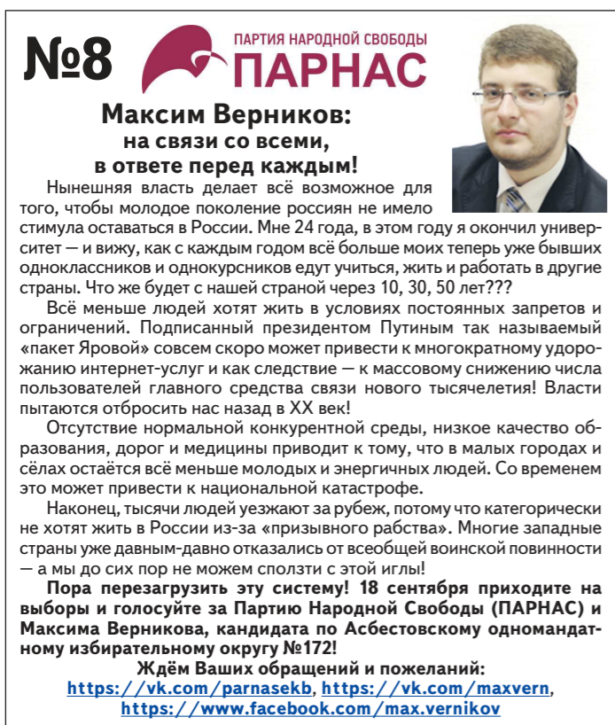
Асбестовский одномандатный избирательный округ №172