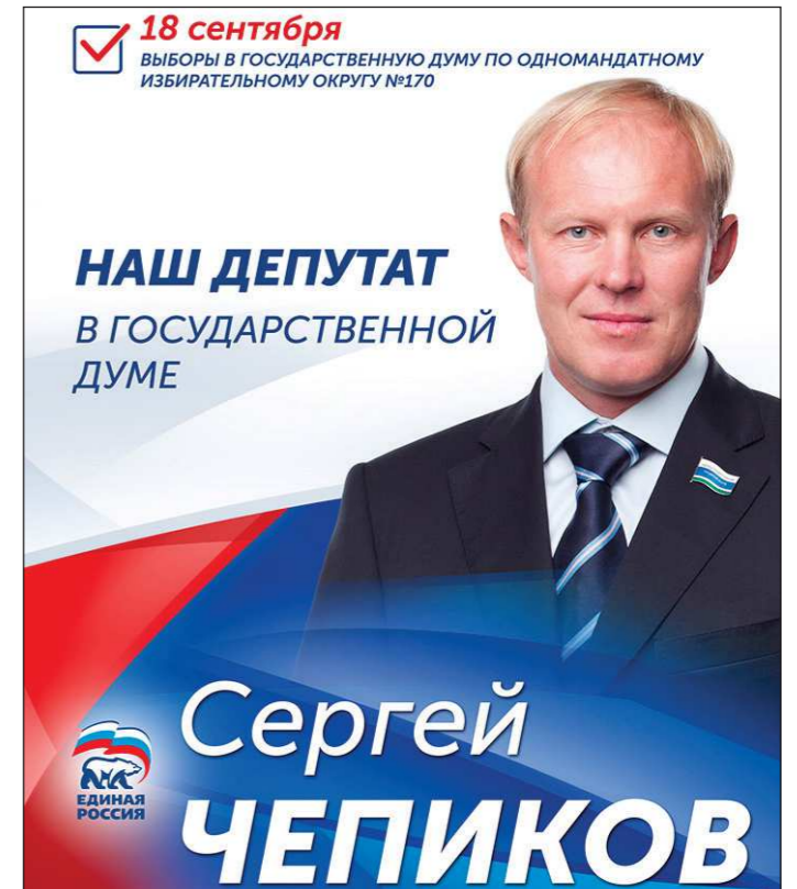
Берёзовский одномандатный избирательный округ №170