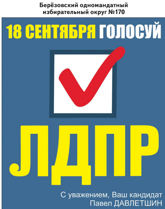
Берёзовский одномандатный избирательный округ №170