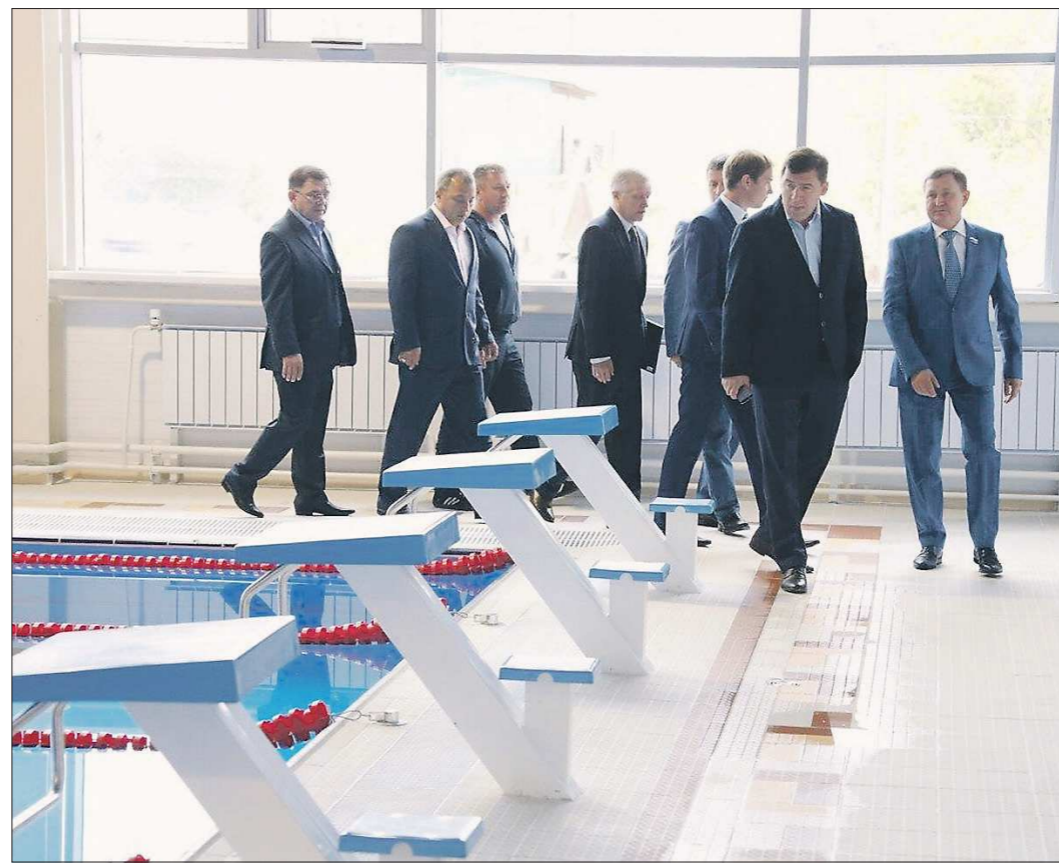
ДЕПАРТАМЕНТ ИНФОРМАЦИОННОЙ ПОЛИТИКИ СВЕРДЛОВСКОЙ ОБЛАСТИ