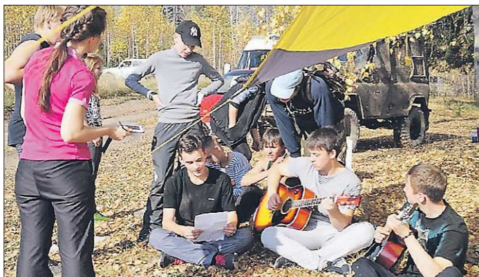
По субботам черноисточинские школьники не сидят за партами, а ходят в походы

Сейчас в Нижнем Тагиле в соцсетях проходит опрос жителей по переходу на пятидневку в школах. Подавляющее большинство за. Но есть обязательное условие, которому городская система образования пока не соответствует — многие школы ведут занятия в две смены, с обеда учится каждый десятый тагильский школьник. Муниципалитет должен перейти на односменный график. Работа в этом направлении ведётся: в ближайшее время плани-