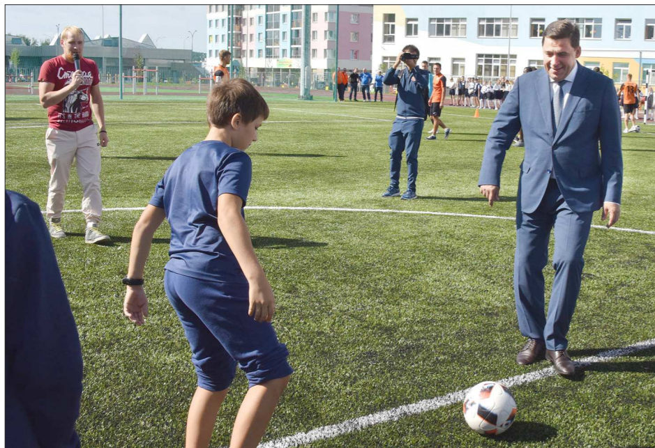
Губернатор Свердловской области Евгений Куйвашев принимал участие в праздновании Дня знаний в новой екатеринбургской школе № 23 и дал старт уникальному футбольному матчу между игроками клуба «Урал» и 200 школьников.