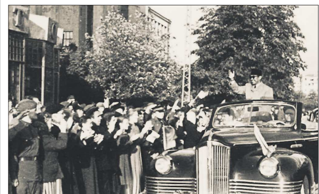
Президента Индонезии Сукарно встречали около 15 тысяч свердловчан