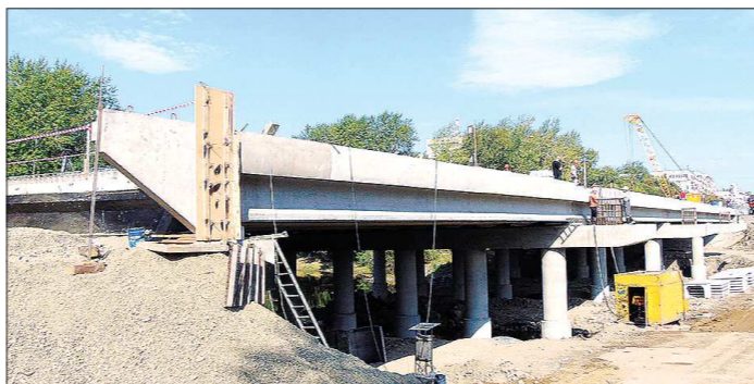
Мост на ул. Фрунзе будет четырёхполосным, с трамвайными путями и тротуарами. Проводится и реконструкция подходов к нему, переустройство теплосетей и освещения. Конструкция моста будет готова на себя нагрузку крупногабаритных и тяжеловесных машин

ПРОСЬБЫ. Ещё скрипит под ботинками гравий и идёт установка карнизных блоков, но новый мост уже есть. Работы здесь остались на месяц-другой. Его тагильчане очень ждут. На одной из самых оживлённых магистралей, открывающей путь из города на север, мост над рекой Тагил был сущим наказанием: узкий, ухабистый, а в последние годы и небезопасный из-за износа несущих опор. Строительстве новой переправы длиной 114 метров первоначально было рассчитано на два года, но мэр Нижнего Тагила не любит тянуть время. По договорённости с подрядчиками мост можно открыть для проезда уже этой осенью. Дело за финансированием. О возможности ускорить пуск объекта и поговорили посреди стройки губернатор и тагильский мэр. Идея тагильчан была поддержана.