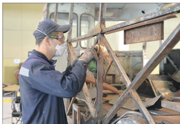
Этот автобус Львовского автозавода, выпущенный в 1970-х годах, доставлен из Крыма. На нём возили сотрудников Академии наук в Симферополе