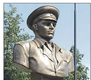
Каменский памятник генералу Маргелову стал первым на Урале

Год назад в Каменске-Уральском на Аллее Славы открыли памятник в честь человека, который никогда в этом городе не был, — бюст генералу армии Василию Маргелову, «десантному батю».