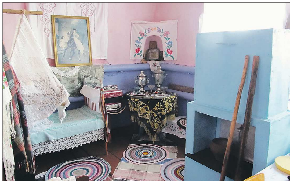
Добро пожаловать в «Уголок русской избы»