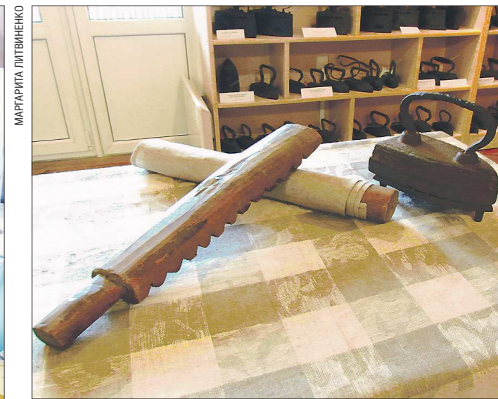
Рубель, валик и чугунный утюг — ими гладили бельё в старину