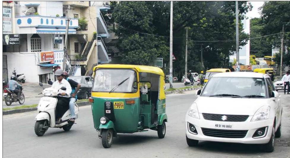
На дельхийских дорогах самые популярные виды транспорта — мопед, рикша и автомобиль

Качественный чай, кофе, благоволия и знаменитые индийские шали и платки посоветовал нам попутать в государственном магазине в районе Коннот-плейс или крытых рыночных комплексах, где цены зафиксированы. Например, полкило чая «Ассам» или «Дарджилинг», произведённого в штате Карнатака, обходится в 300–500 рупий, такой же чай в подарочных деревянных шкалках — от ста рупий. За кашемировский