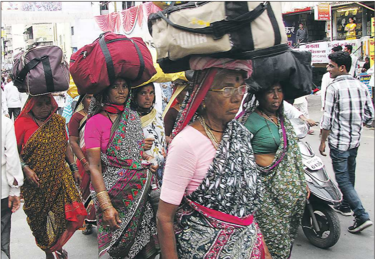
На ежегодный фестиваль «Палхи» тысячи паломников пришли в Пуну. Вещи приносили... на голове

Можно несколько раз перечитать «Шантарам» Грегори Дэвида Робертса, но чтобы постоянно чувствовать Индию, надо самому оказаться в её сердце. Вот мимо, подрезая «Фиат», пролетает жёлто-зелёная рикша (трёхколёсный мотоцикл), за ней — семья из четырёх человек на двухколёсном мотоцикле. В десяти метрах, на обочине местный житель продаёт шлемы для мотоциклистов, подальше — лотки с манго, бананами и кокосами по 15 рупий*, чаны с индийскими пончиками «гулаб джамун» и велорикши с мороженым. Неподалёку пасутся бесхозная корова и буйвол, которых сердоболые горжаны подкармливают остатками фруктов. Один из продавцов окуривает торго-