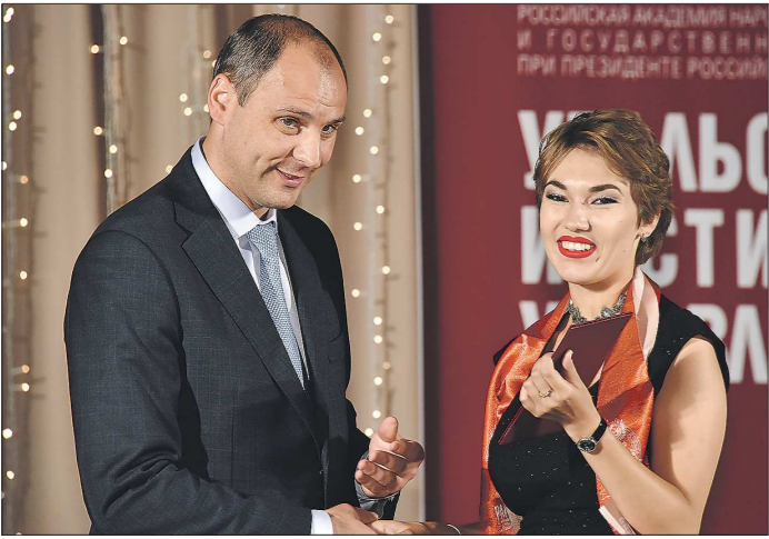
Возможно, фото с областным премьером в портфолио станет аргументом в пользу выпускника при приеме на работу