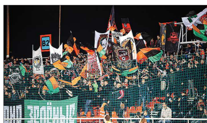
Продажа билетов на спортивные соревнования не должна стать помехой для законопослушных болельщиков

Но по большому счёту, дело это хоть и хлопотное, но нужное. Другими способами ввести насилие на стадионах не получится. Делать это вообще надо было бы намного раньше, но сейчас поведение некоторых наших болельщиков во Франции и неотвратимо приходящий чемпионат мира по футболу 2018 года стали катализатором процесса. Теоретически нововведения могут коснуться абсолютной всех спортивных соревнований, собирающих большую аудиторию. Конкретный перечень в ближайшем времени должно определить правительство Российской Федерации. Среди