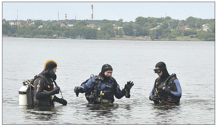
Согласно предписанию санитарных врачей, купаться в свердловских водоёмах можно только в гидрокостюмах

Владелец авто может забирать транспортное средство до эвакуации, если причина нарушения установлена. А само задержание теперь может применяться только в целях пресечения отдельных нарушений правил эксплуатации и управления.