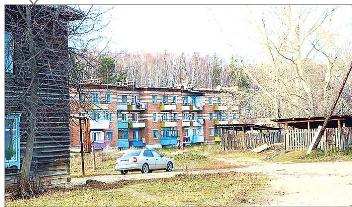
В посёлке Молодёжном Берёзовского ГО только одна трёхэтажка. Остальные — двухэтажные бараки и частные дома