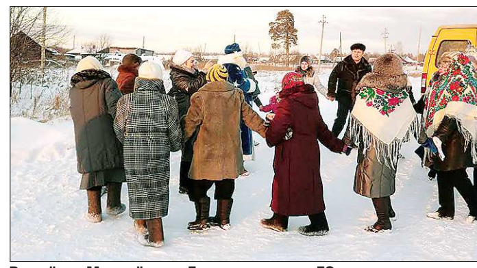
В посёлке Молодёжном Горноуральского ГО живут в основном пожилые люди. Каждый год 30 декабря активисты из Покровского приезжают поздравить их с Новым годом