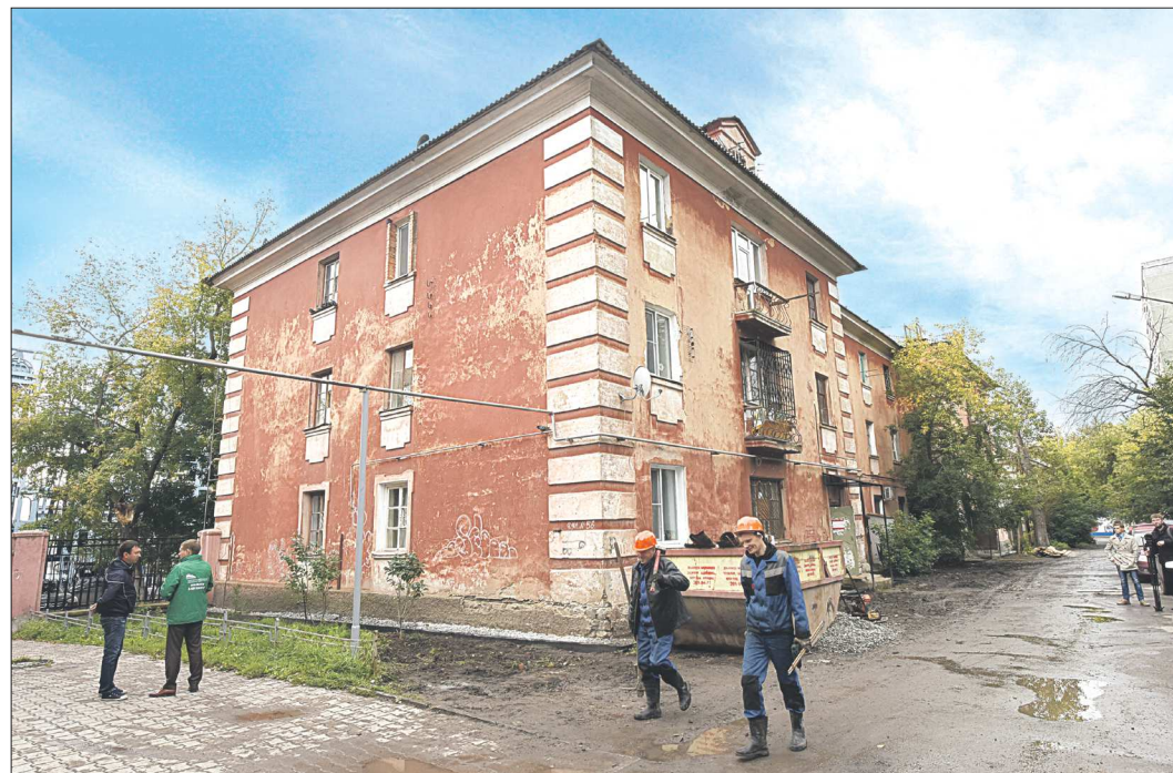
В Свердловской области взносы на капремонт ежемесячно платят жильцы более 29 тысяч многоквартирных домов. Все эти дома должны быть отремонтированы в течение 30 лет

Льгота распространяется только на неработающих и одиноко проживающих пенсионеров, имеющих в виду не только одинокие граждане, но и семьи, состоящие только из пенсионеров.