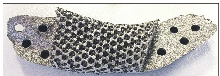
Экспериментальные уральские импланты – челюстной (на фото слева) и фаланги пальцев, внешне напоминающие шурупы (справа). Внутри у искусственных костей видна пористая структура

«ОГ» заинтересовалась содержанием аналогичных региональных законов в соседних субъектах Федерации. Пенсионеры Пермского края, Челябинской и Тюменской области также поставлены перед альтернативой: если есть право на льготу по нескольким основаниям, получить компенсацию можно лишь по одному из них по выбору гражданина.