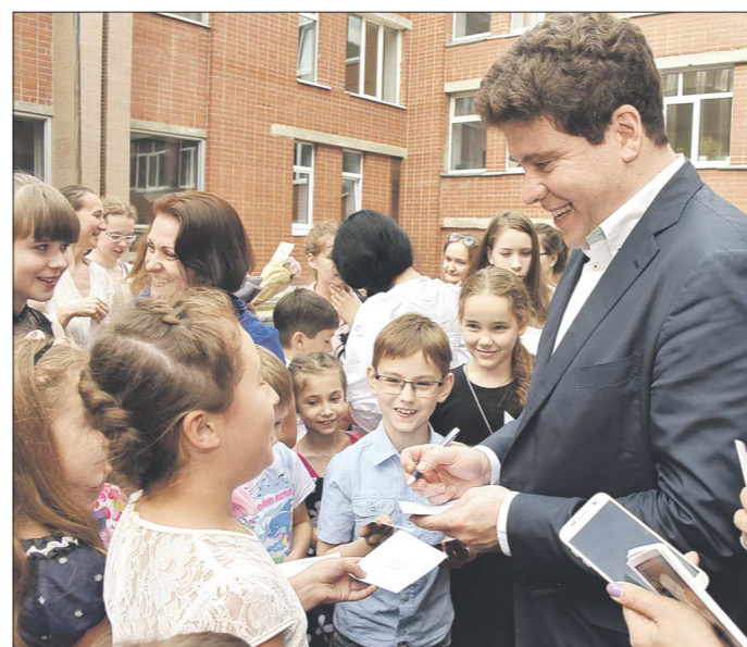
Денис Мацуев взял на карандаш всех талантливых свердловчан. Фоторепортаж – на сайте oblgazeta.ru

– Начну с того, что очень приятно бывать здесь. Мой роман с Екатеринбургом длится уже больше двадцати лет. Здесь потрясающий оркестр, который является визитной карточкой нашей области. Конечно, основной акцент фестиваля делается на поиске новых талантов. Мы уже посетили более 70 регионов. А Свердловская область – одна из ключевых музыкальных точек для подобного поиска. За три дня вы увидите