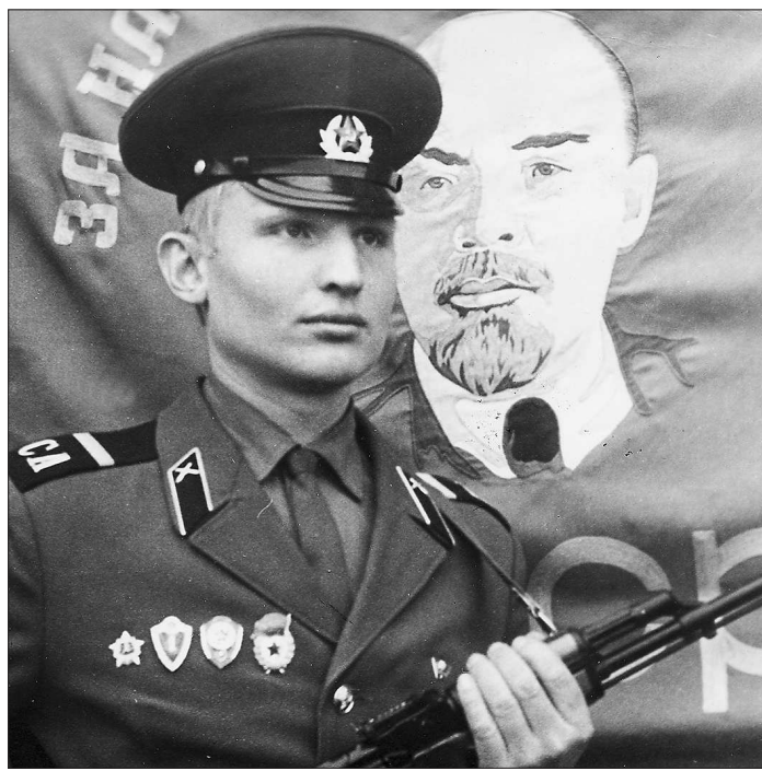
1975 год. Фотографирование у развёрнутого боевого знамени части по уставу было высшим поощрением для срочников