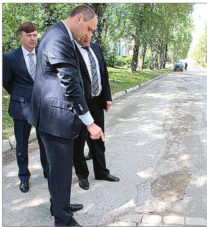
Денис Паслер убедился, что некоторые участки дорог в Дегтярске требуют скорейшего ремонта

Председатель правительства Свердловской области Денис Паслер побывал в Дегтярске, где обсуждалось состояние местных дорог. Этим летом в городе освоят 20 областных миллионов, но эта сумма обеспечит лишь малую часть необходимого ремонта. Поэтому муниципалитету дополнительно выделят 90 миллионов рублей из региональной казны. «ОГ» выяснила, на какие именно объекты уйдут эти деньги.