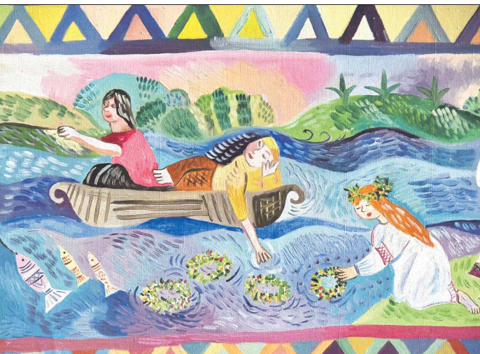
Выставку можно увидеть в Музее истории Екатеринбурга в течение двух недель

возвращаюсь. Даже стала замечать, что и остальные темы стали с ней пересекаться. Мифология — это история, которую мне интересно изучать. Но я никакой не русофил, и ни в какие этнические группы не вхожу. Мне интересны многие вещи, но я не призываю вернуть языческие ритуалы. Это важно. Я не фанатик.