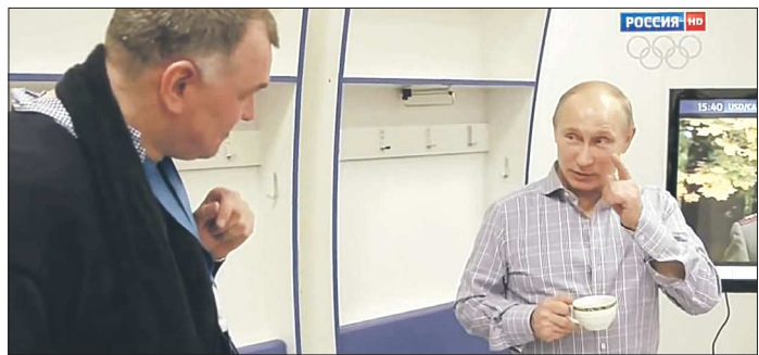
Редкий момент — Сергей Мирошниченко поступился своими принципами и «зашёл» в кадр. В непринуждённой обстановке режиссёр с президентом подшучивают друг над другом. Но появляется и неудобный вопрос президенту от Мирошниченко по поводу предстоящих Игр: «Мы, русские люди, всегда боимся, получится ли?» — «Не все», — твёрдо отвечает Путин

Одну из главных ожидаемых премьер Года кино — «Кольца мира» — представил, пожалуй, самый успешный на сегодняшний день документалист страны — Сергей МИРОШНИЧЕНКО. Фильм про Игры в Сочи, но на самом деле — не только про них. Это скорее размышление о философии спорта и о его объединяющей силе. Мирошниченко был главным хроникёром всего процесса — от подготовки до послесловия... И как говорит сам режиссёр, именно сейчас эта картина как никогда актуальна.