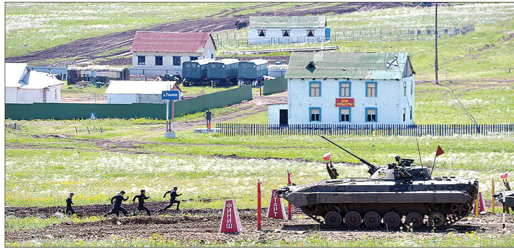
Каждая команда выставляет по одному танку и по три экипажа. Мах флажком — и первый экипаж из трёх танкистов из всех сил бежит к машине