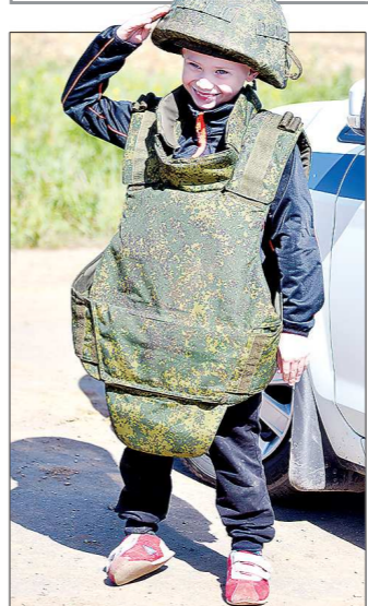
В перерывах между заездами дети, которых среди зрителей было немало, охотно примеряли бронежилеты

Танки: 1-е место — Восточный военный округ 2-е место — Западный военный округ 3-е место — Высшее Казанское военное училище БМП: 1-е место — Тихоокеанский флот 2-е место — Восточный военный округ 3-е место — Дальневосточное высшее общевойсковое командное училище