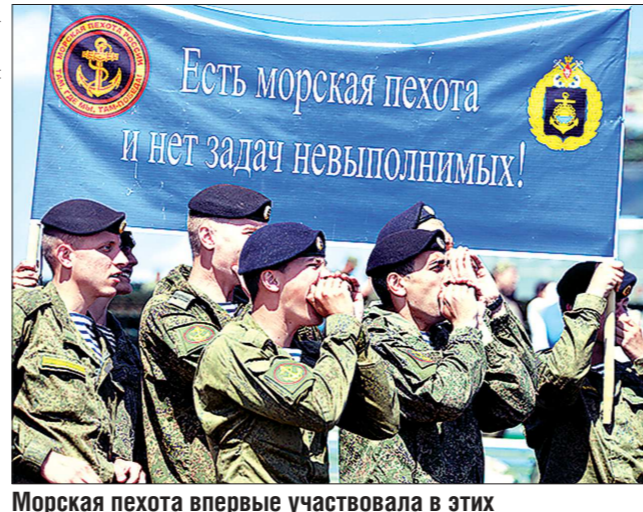
Морская пехота впервые участвовала в этих соревнованиях. Северный флот преодолел препятствия на танках, а Тихоокеанский — на БМП