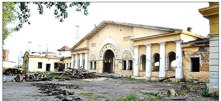
К концу июня на месте старого вокзала будет чистая площадка

В соответствии с Федеральным законом от 03.11.2006 № 174-ФЗ «Об автономных учреждениях» и постановлением Правительства Свердловской области от 30.01.2009 № 64-ПП «Об утверждении форм отчётов о деятельности государственного автономного учреждения Свердловской области и об использовании закреплённого за ним имущества» ГАОУСО «Редакция газеты «Сельская новь» публикует отчёт о деятельности государственного автономного учреждения и отчёт об использовании имущества, закреплённого за государственным автономным учреждением, за 2015 г. на портале www.pravo.gov66.ru в разделе: «Официальная информация юридических лиц».