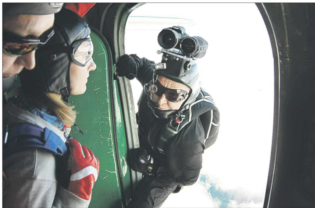
Из самолёта воздушный оператор выходит чуть раньше, чем tandem-инструктор с пассажиром, чтобы успеть снять сам момент прыжка

– Фотографией я увлеклся с детства, но сейчас я скорее видеооператор, чем фотограф. Изначально парашютный спорт снимал только на видео – это единственное средство судейской регистрации результатов. И лично мне интереснее всего снять весь прыжок – инструктаж, выход из самолёта, полёт в свободном падении и под куполом и приземление – так, чтобы получившийся фильм потом не пришлось монтировать, а его герой и через десять лет с удовольствием смотрел и показывал это видео друзьям, снова осязая те эмоции. С парашютом впервые прыгнул лет десять назад, когда перешагнул 35-летний рубеж. Прыгнул один раз, потом второй. После третьего инструкторы предложили остаться. Четвёртый и пятый прыжки выполнил в один день. Сей-