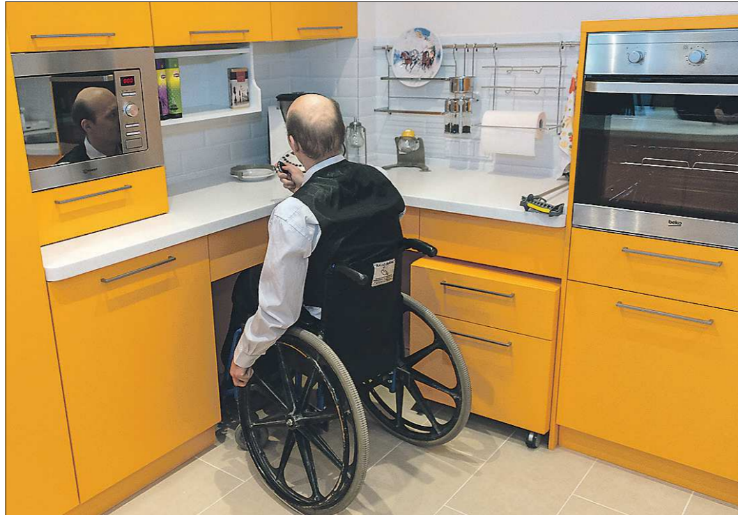
Теперь специалисты медико-социальной экспертизы ещё внимательнее, чем раньше, смотрят на способность инвалидов самостоятельно себя обслуживать