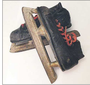
Интересно, что коньки верхотурского завода с рук можно купить и сегодня. Так, недавно на одном из популярных сайтов появилось объявление о продаже таких коньков 1952 года выпуска. Цена — 800 рублей для производства гильз.

Предприятие разместили в здании бывшего казённого винного склада 1906 года постройки. Три двухэтажных корпуса из красного кирпича, соединённых одноэтажными переходами, можно и сегодня увидеть в Верхотурье на перекрёстке улиц Ленина и Комсомольской. Оборудование для будущего завода на Урал привезли из Германии с фирмы «Вебер» — в первые послевоенные годы это было распространённой практикой. Интересно, что на родине все эти станки использовались... для производства гильз.