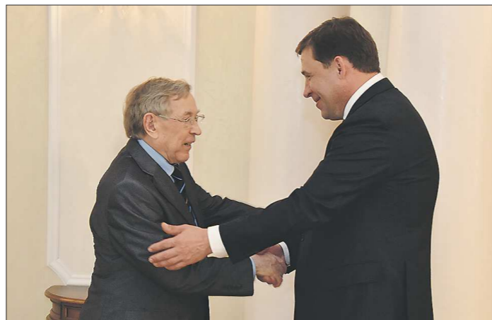
Во время встречи с губернатором Вениамином Яковлевым (слева) в своё время получил высшее образование, а затем много лет посвятил научной и преподавательской работе в Свердловском юридическом институте

Тема юбилейного, десятого, конгресса — «Право, политика и экономика в современном мире: вызовы XXI века». Организаторами мероприятия выступают Ассоциация юристов России и Уральский государствен-