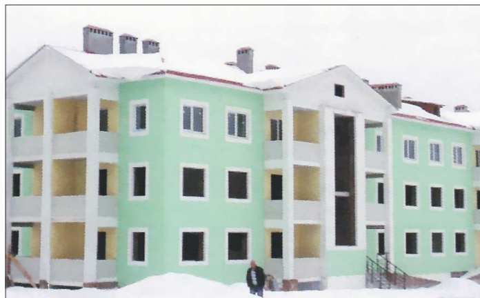
Программный дом по улице Почтовой в Дегтярске ещё не достроен. Пока квартиры здесь планируют приобрести только пять семей

Как рассказали «ОГ» в администрации Полевского ГО, в программе должны были участвовать более ста семей. Их уведомили, что при желании они могут обратиться в соседние муниципалитеты, где программа реализуется более плодотворно. Но, как пояснили в мэрии, большинство