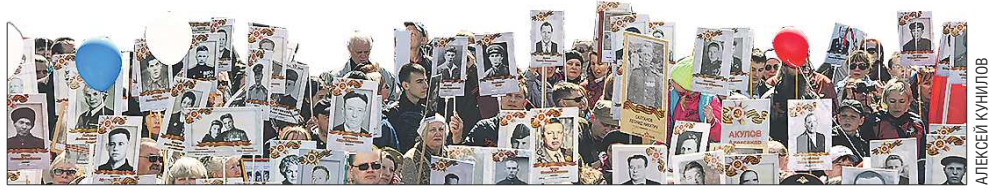
Акция «Бессмертный полк»