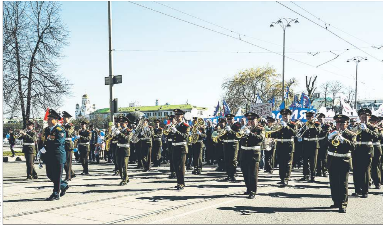
Традиционная Первомайская демонстрация в центре Екатеринбурга. Колонна дошла до площади 1905 года, где начался митинг. Участие в шествии приняли более 20 тысяч человек: члены профсоюзов, сотрудники предприятий, активисты политических партий. Во главе колонны был духовой оркестр