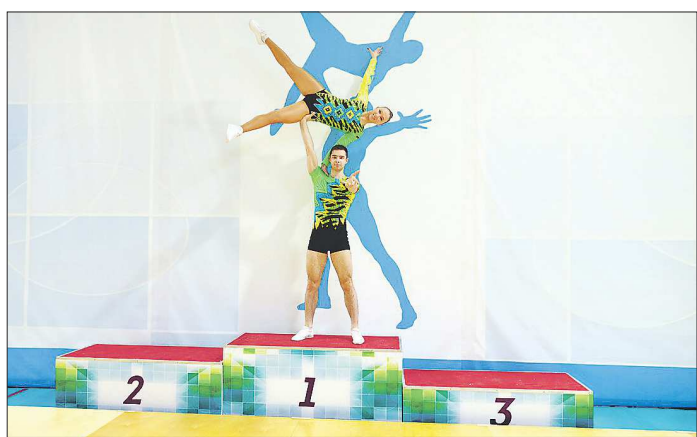
Для выполнения акробатических элементов требуется хорошая физическая форма, поэтому тренируются спортсмены трижды в день