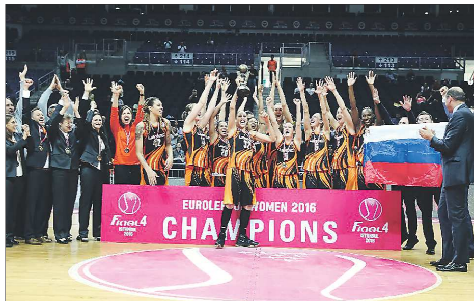
Момент триумфа. Чемпионский кубок в руках у Дайаны Таурази

В стане болельщиков «лисиц» ликование, а недоброжелатели меж тем обращают внимание на весьма скром-