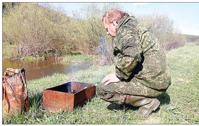
Успокойтесь, граждане! Собрать сучья для костра никто не запрещал