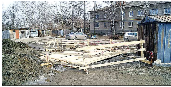
Чтобы никто из местных жителей не провалился в яму с отходами, её временно накрыли деревянными досками