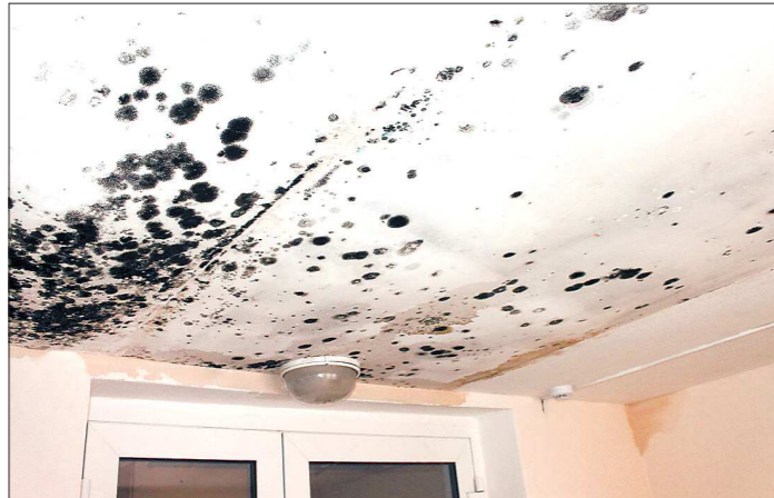
Протечку кровли в тамбуре алапаевского садика подрядчик обещал устранить уже в июне. Вместе с ней должна сойти и плесень

Сразу в двух детских садах Алапаевска — в самом городе и посёлке Нейво-Шайтанском — проявились строительные дефекты. На объектах, сданных буквально полгода назад, начала трескаться штукатурка, протекать крыша, в отдельных местах даже появилась плесень. Родители детей, посещающих детский сад, серьёзно обеспокоились, но работники образовательных учреждений не растерялись и обратились с жалобами в дирекцию единого заказчика. В ближайшее время подрядчики займутся устранением недостатков.