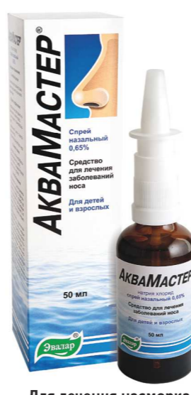
Для лечения насморка

Заказывайте на сайте apteka.ru с бесплатной доставкой в ближайшую аптеку.