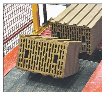
Особенность нового кирпича — стык, не требующий заполнения раствором. Это позволяет уменьшить расход раствора в 3-5 раз, что снижает и стоимость объекта

Для нынешних сотрудников ревдинского завода перевод в новый цех сопоставим с повышением по службе. Здесь всё максимально автоматизи-