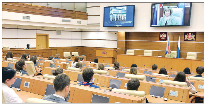
Школьников на встрече было много, и чтобы все вошли в зал, их пришлось разбить на две группы