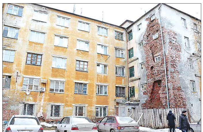
За 83 года дом ни разу капитально не ремонтировали и, судя по его состоянию, вряд ли успеют

всегда быстро и единогласно. Стратегию развития Новоуральска до 2030 года мы разработали полтора года.