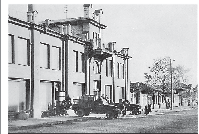
Разгрузка коллекций Эрмитажа, эвакуированных из Ленинграда, перед зданием Свердловской картинной галереи по адресу Вайнера, 11