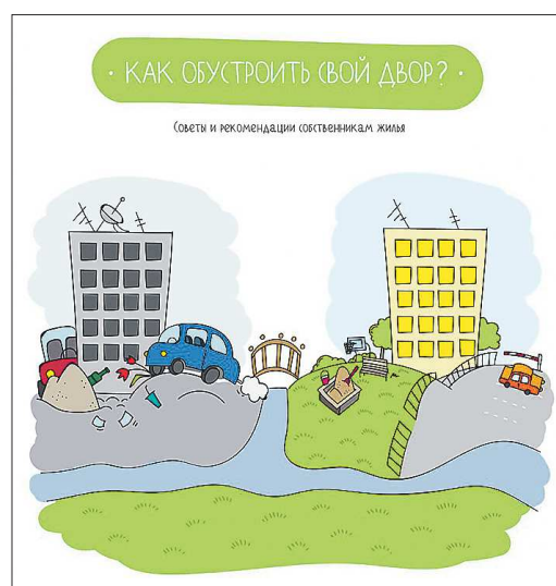
Комиксы снабжены не только весёлыми картинками, но и советами и ссылками на законы

Комиксы с пошаговыми инструкциями о том, как справиться с дворовыми «автохамами» и грязью, разбить во дворе клумбу или детскую площадку, опубликованы на сайте администрации.