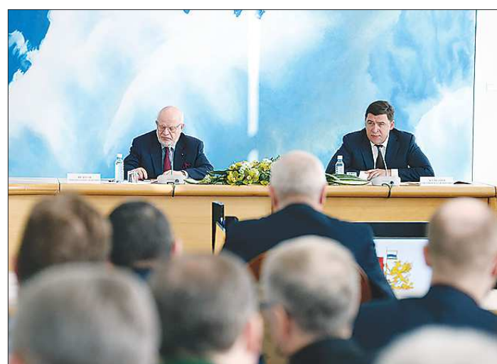
Хотя в СПЧ не принято дважды проводить выездные заседания в одном и том же регионе, для нашей области было сделано исключение: именно в Екатеринбурге совет впервые провёл выездное заседание в день открытия памятника Борису Ельцину — 1 февраля 2011 года