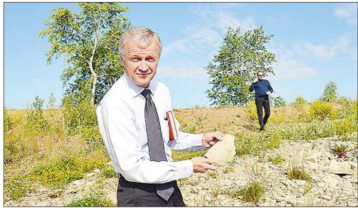
Вновь избранный глава в работе опирается на народную мудрость: «Под лежачий камень вода не течёт»