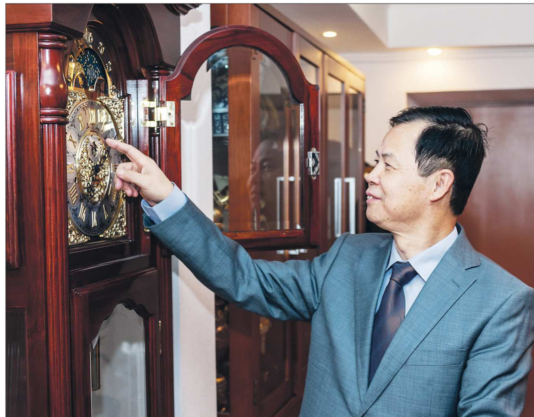
Тянь Юнсян уверен, что за десять лет его страна удвоит валовой внутренний продукт

— Господин консул, в марте состоялся четвертая сессия Всекитайского собрания народных представителей (ВСНП) 12-го созыва и четвертая сессия Всекитайского комитета Народного политического консультативного совета Китая 12-го созыва. ВСНП рассмотрел и принял план экономического и социального развития страны на 2016–2020 годы (13-я пятилетка). Этот план вызывает огромный интерес не только в Китае, но и во всём мире. Какие важнейшие задачи планируют решить Китай в рамках 13-й пятилетки?