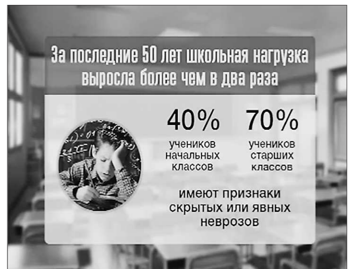
Рис. 15. Доля учащихся, имеющих признаки невроза.

Об общей ситуации со здоровьем несовершеннолетних Не секрет, что школьная среда скрывается на здоровье ребёнка, и за время его учёбы возникает так называемая «школьная» заболеваемость. По различным данным, 70-90% детей к окончанию школы имеют: миопию (близорукость), гастрит, нарушение осанки. Далее следуют — вегетососудистая дистония, неврозы (рис. 15), травмы на уроках физкультуры и на переменах и т.д. Кроме того, в течение первых лет учёбы в школе ребёнок неоднократно переносит самые разнообразные инфекционные заболевания, в т.ч. респираторные и кишечные.