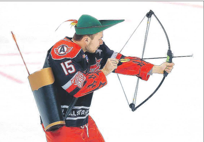
На «Матч звёзд КХЛ» форвард нарядился Робин Гудом - этот образ он сам предложил организаторам