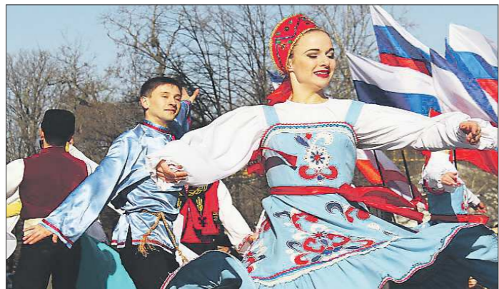
Праздничный концерт в центре Симферополя. Такие в эти дни проходят во многих городах полуострова

Сегодня Свердловская область вместе со всей страной отмечает вторую годовщину воссоединения Крыма с Россией. «ОГ» спросила жителей разных городов полуострова: а что бы они сказали уральцам, если бы смогли лично присутствовать на праздновании «Крымской весны» в уральской столице?