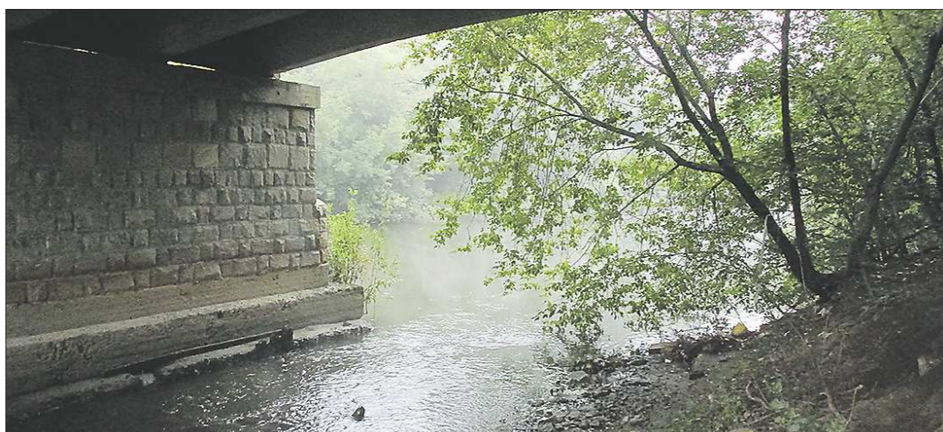
Больше всего от канализационных стоков достаётся Исети — сюда сливается основной объём вод. После реконструкции очистных можно надеяться на улучшение состояния реки

Очистные сооружения Екатеринбурга не очень-то справляются с очисткой канализационных стоков. 50 процентов проб, взятых в прошлом году, не соответствуют санитарным нормам. Вода, «обогащённая» продуктами хозяйственно-бытовой жизни целого города-миллионника, уходит в реки Исеть и Камышенку.