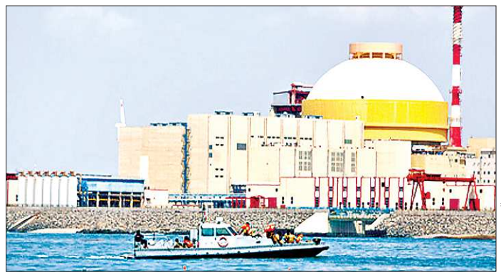
В 2016 году на АЭС «Куданкулам» может быть сдан в эксплуатацию второй энергоблок (в дополнение к первому). Для него Уралмашзавод уже изготовил перегрузочную машину и несколько специальных кранов

+/- — рост / падение по отношению к предыдущему показателю