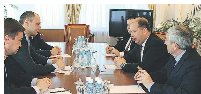
В числе перспективных направлений сотрудничества Среднего Урала и Словакии на встрече были названы лесопереработка, машиностроение и фармацевтика