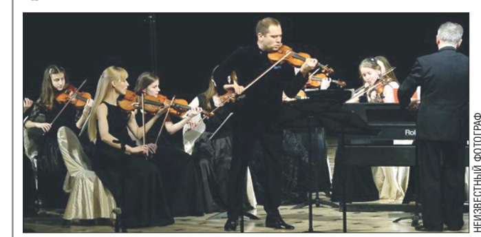
Скрипач Дмитрий Коган впервые за три года дал концерт в Екатеринбурге. 8 марта он выступил в Театре драмы перед ветеранами, педагогами и медиками (всего 300 человек).