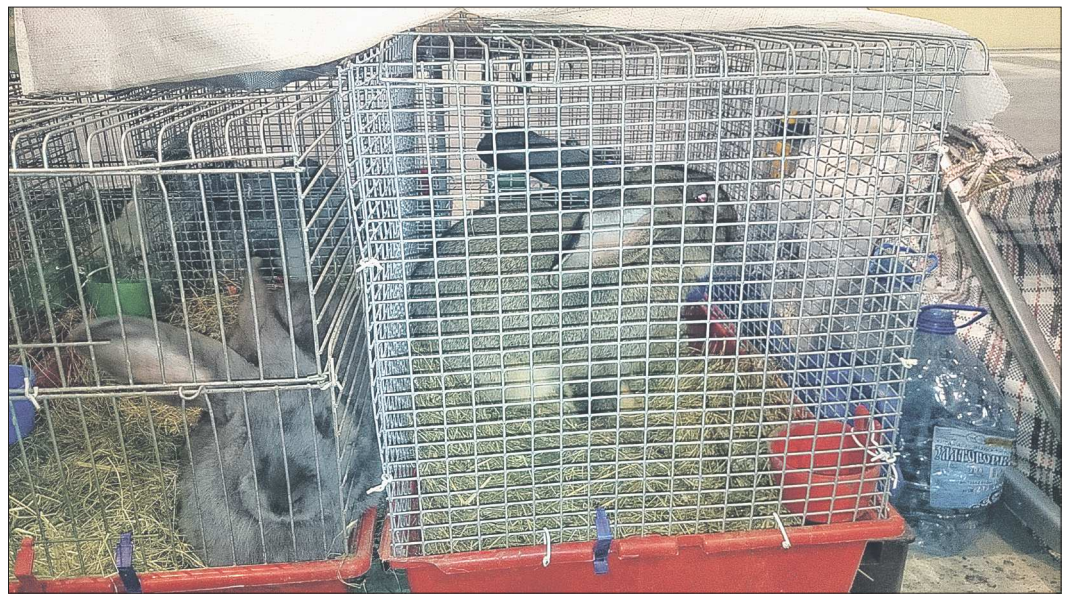
Кольцовские узники: условия проживания на складе вряд ли можно назвать нормальными, хотя там тепло и светло

Вот уже почти четыре месяца, с 18 ноября прошлого года, на складе временного хранения Кольцовской таможни томится 12 племенных кроликов породы Ризен — Немецкий великан.