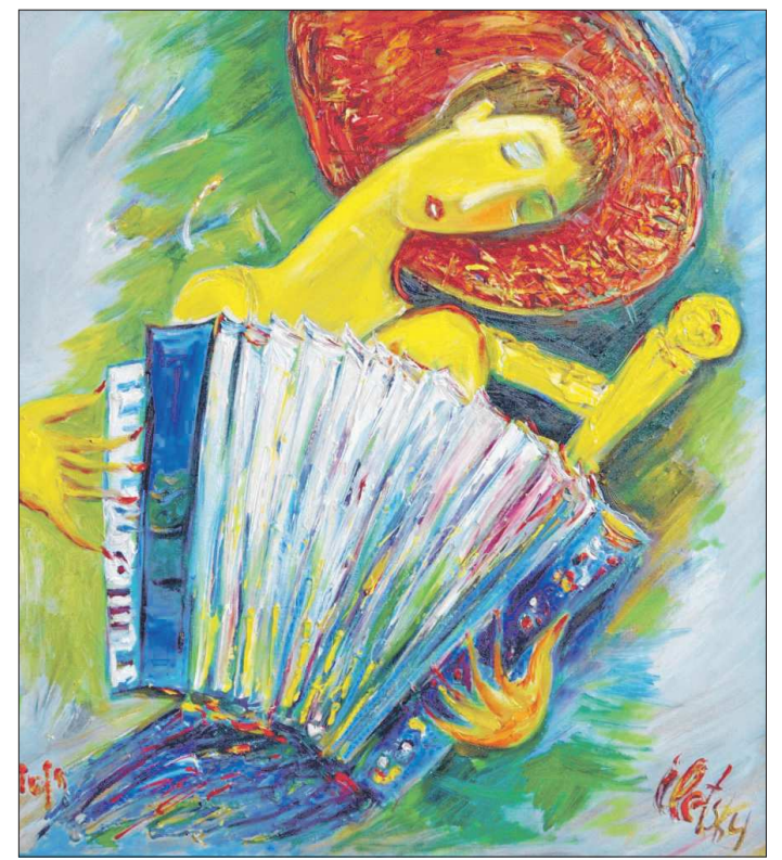
«Аккордеонистка». Всего же на выставке представлено 14 работ