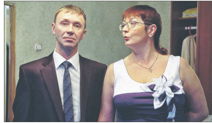
Кадр из фильма «Надежда. Вокруг да около». Он выходит в прокат с 10 марта. Цена билетов от 100 до 200 рублей

— Честно говоря, складывается впечатление, что ди-