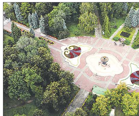
Сегодня дендропарк открыт для всех желающих с восьми утра до десяти вечера

Хлебный рынок (он же — Хлебная площадь) просуществовал на углу нынешних улиц Куйбышева и 8 Марта больше ста лет — с 1825 года и до начала 1930-х годов. В тридцатые хлебную площадь упразднили и создали на её месте Сад пионеров (позже — Сад юного мичуринца) — предшественник дендрария.